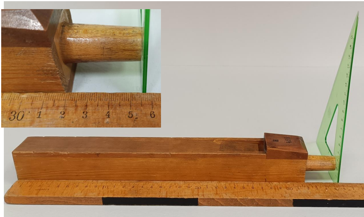
Obr.1 Určení délky píšťaly s detailem výsledku měření L = 35,5 cm.

Postup práce: pomocí délkového měřidla změřte s přesností na mm délku píšťaly, viz obr.1 s detailem odečtu délky. Hodnotu převedte na metry. Další postup je uveden v jednotlivých úkolech.